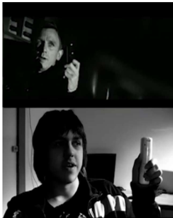
En gruppe elever har lavet en remake af starten på Casino Royale. Søg STUGPH på Youtube.

Vi sorterer ikke elever efter hvor meget vi tror de kan klare, men ser hvor langt den enkelte kan nå. Af vores første årgang på seks elever gik to videre på en faglig uddannelse allerede efter to år, og en tredje ansøger om optagelse i gymnasiet.